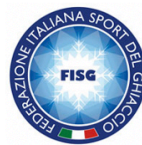
FEDERAZIONE ITALIANA SPORT DEL GHIACCIO