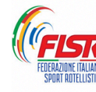
FEDERAZIONE ITALIANA SPORT ROTELLISTICI