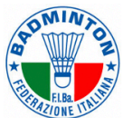
FEDERAZIONE ITALIANA BADMINTON