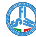
FEDERAZIONE ITALIANA SCI NAUTICO E WAKEBOARD