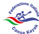
FEDERAZIONE ITALIANA CANOA KAYAK